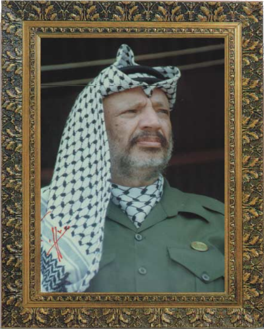
سيادة الأخ الرئيس ياسر عرفات رئيس دولة فلسطين