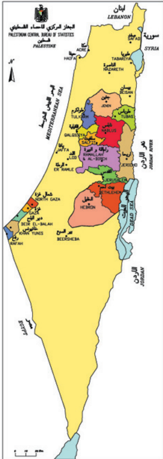
خريطة 1: محافظات فلسطين